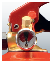
Manometer und Prüfventil